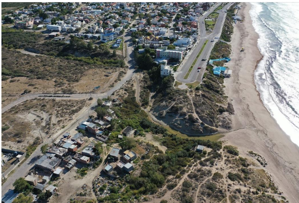
Figura 2. Barrio Los Pulperos

El barrio está en condición de vulnerabilidad, debido a falta de tenencia de la tierra, privación de servicios básicos, ausencia de acceso directo al mar y una precaria conectividad vial. Además, posee basurales a cielo abierto y sufre con la contaminación del Cañadón de la Paloma lindante al barrio, lo que produce distintos impactos socio-ambientales. Esto afecta a sus habitantes cotidianamente, en las actividades laborales y educacionales, la calidad de vida, la convivencia con el ambiente y el uso del espacio público, generando problemas de salud y de integración socio-espacial. A lo que se suman las tensiones con otros barrios aledaños con condiciones socioeconómicas contrastantes, que descreen o minimizan su identidad pulpera y su rol como precursores en el territorio, imponiendo barreras físicas y simbólicas que producen estigmas y relegan a los residentes del barrio a la exclusión socio-espacial.