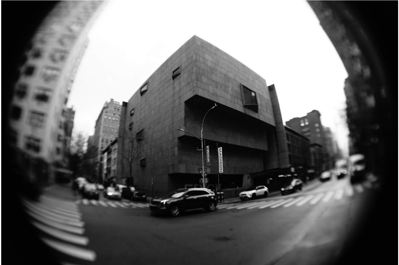
Figura 5. Exploración y registro fotográfico del Whitney Museum of American Arts , en la ciudad de Nueva York, creación de Marcel Breuer, hoy denominado como Met Breuer