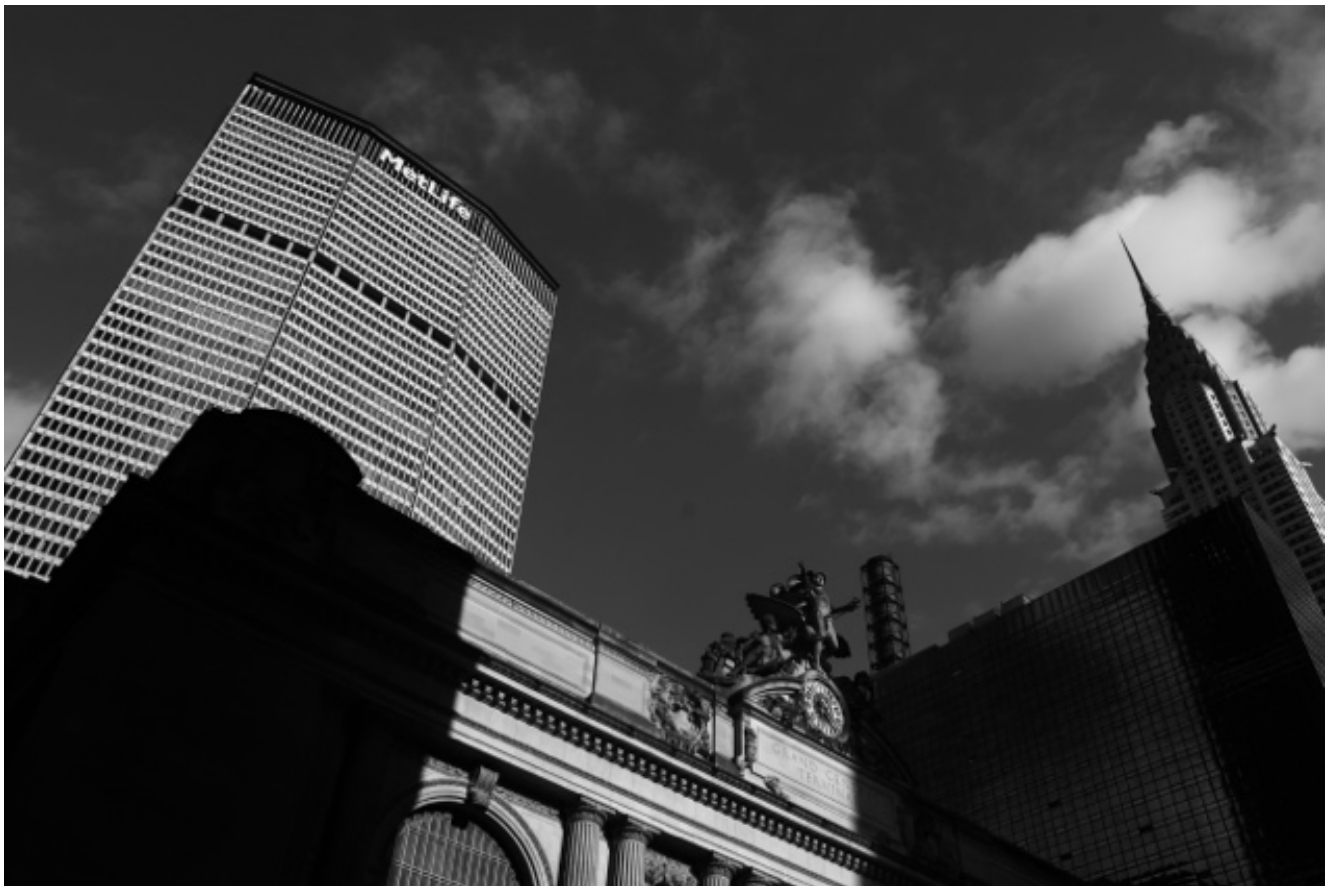
Figura 4. Exploración y registro fotográfico del PanAm Building , en la ciudad de Nueva York, creación del arquitecto Walter Gropius, hoy denominado como MetLife Building . Elaboración propia.

Este ejercicio de revisión histórica y de referentes, se plantea como base para el desarrollo de una serie de propuestas creativas en el campo de la identidad visual, con la participación de integrantes de la Universidad Técnica de Cotopaxi, en las cuales se busca aplicar diversos elementos formales, simbólicos, tipográficos y cromáticos, al igual que algunos procesos de abstracción, propios de la Bauhaus, dando lugar a ideas de marca región o marca ciudad, estableciendo un vínculo entre unos planteamientos que surgen en contextos y tiempos aparentemente lejanos, frente a unos procesos de creación en un entorno actual y particular, con su patrimonio cultural e identidad (Figura 3) (Ángel-Bravo, 2018a).