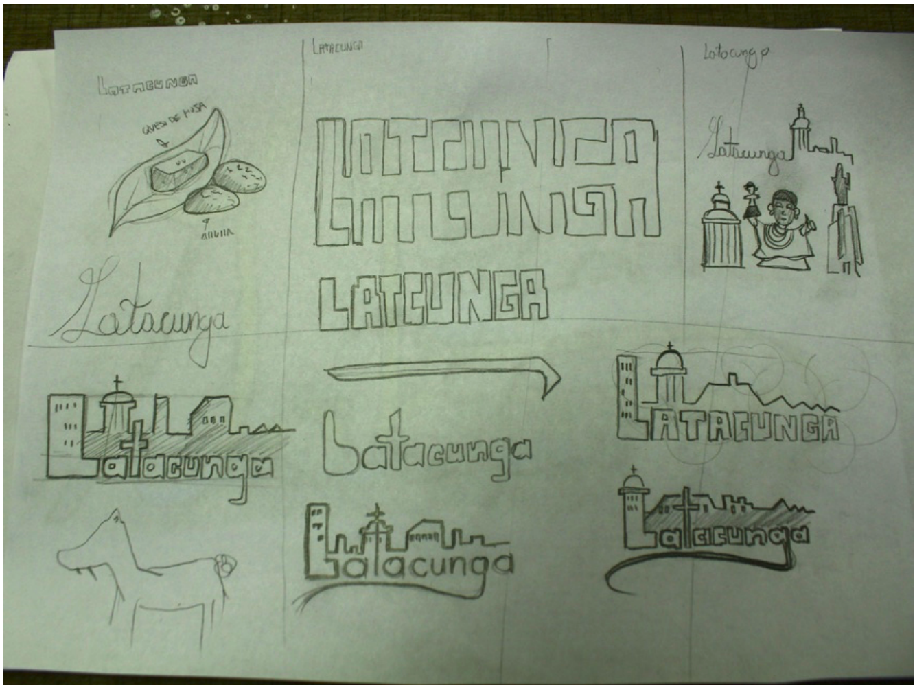
Figura 3. Proceso de bocetación para la creación de marca región y marca ciudad, a partir de conceptos y planteamientos estéticos de la Bauhaus , Universidad Técnica de Cotopaxi. Latacunga, Ecuador.

La realización de entrevistas a personal docente en áreas asociadas al diseño, en gran medida hace evidente el impacto y la vigencia que hoy en día tienen los planteamientos de esta escuela, en la formación académica y en el desarrollo de proyectos utilitarios y comunicacionales.