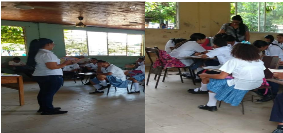
Sentimientos reflejados en los niños.

Estos temas desarrollados en el aula se desarrollarán por medio de las obras de teatro acompañados por el dialogo reflexivo en todo momento, además se desarrollaron socializaciones, lluvia de ideas y trabajo grupal como forma de apoyo a todas las actividades propuestas.