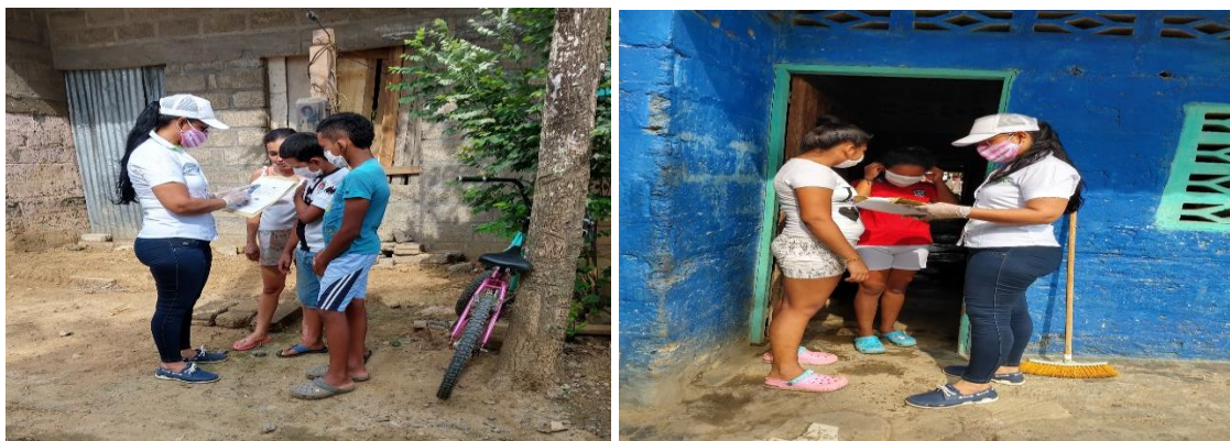
Imagen 2. Visitas domiciliarias para entrega de material pedagógico educativo (guías) a algunos estudiantes, debido a la emergencia sanitaria COVID-19 ya que no cuentan con acceso tecnológico.